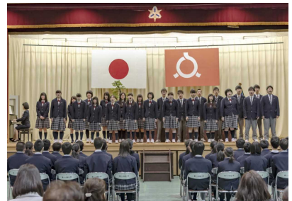
在校生による校歌披露