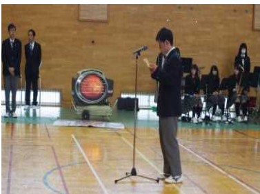
新入生歓迎あいさつ