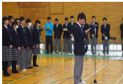
新入生代表あいさつ