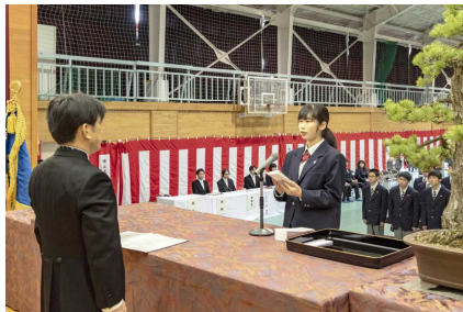
新入生誓いの言葉