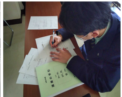
真剣にメモを取る生徒