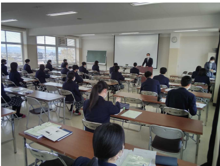
各先生方からの話

各学年の生徒達は、それぞれの先生方のお話を静かに聞きながら、必要に応じて配布されたプリントにメモを取るなど真剣に取り組んでいました。