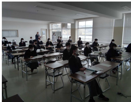
説明を聞く生徒達