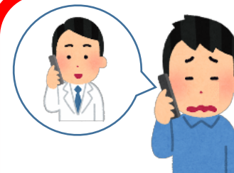
体調悪化を感じたら 迷わず相談