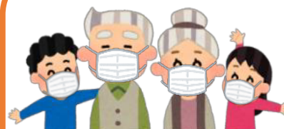
マスクの着用 (高齢者の感染予防等)