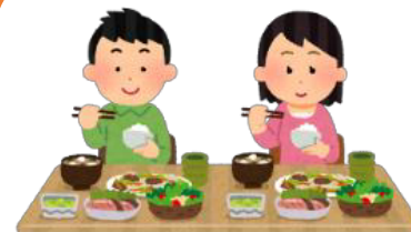
大皿は避けて 料理は個々に