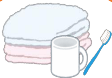
コップ・タオル等 の共有は避けて